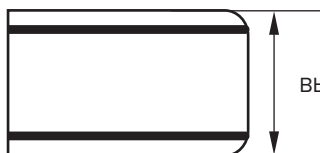
Схема измерения габаритов матраса

Аналогичным способом измеряется длина и ширина матраса. ГОСТ на изготовления матраса допускает отклонения от габаритов +/-20 мм. Ширина окантовочной ленты при этом в расчет не принимается.